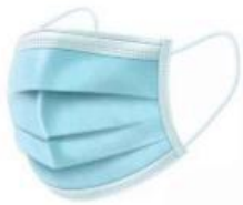
挂耳式医用外科口罩