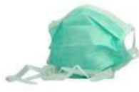
系带式医用外科口罩